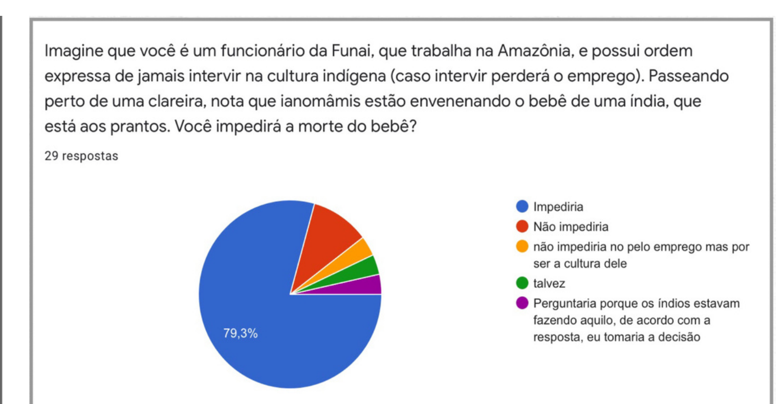
Figura 2.

Também foi realizada uma proposta de intervenção com a sala, onde foi iniciado com aplicação de um formulário perguntando o que eles sabiam sobre ética e moral, muitos entendiam à ética como: empatia, caráter, entre outros. E sobre a moral eles entendiam como: regras comportamentais, honestidade, entre outros. Em seguida foi explicado o conceito de ética e moral e a diferença entre elas.