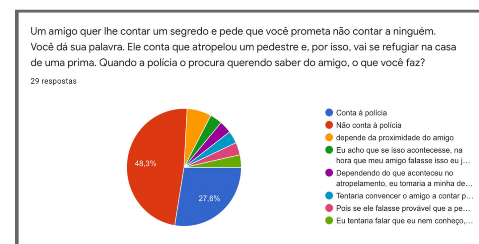
Figura 1. Fonte: próprio autor.

Foi feito um questionário com alunos do 8º e do 7º ano com quatro dilemas morais e situações onde o desenvolvimento moral é aplicado.