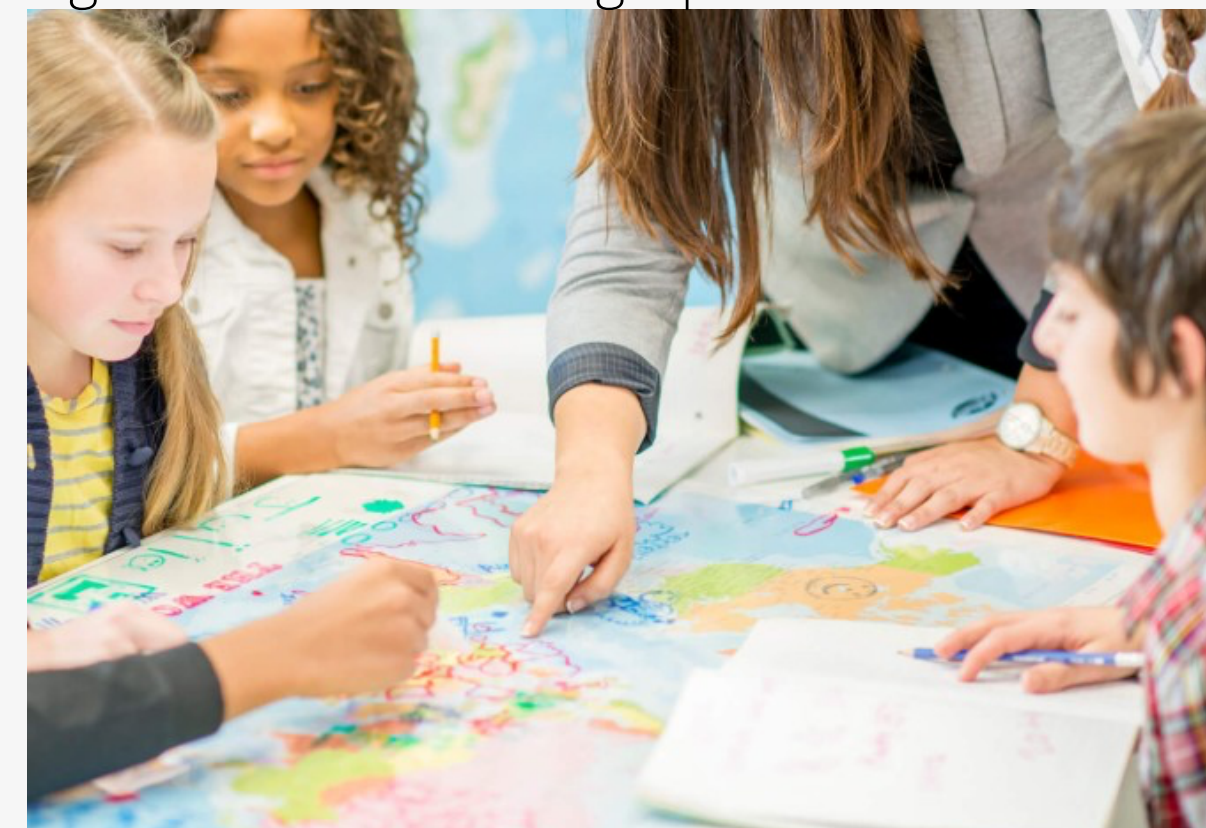
Figura 2: Trabalho em grupo