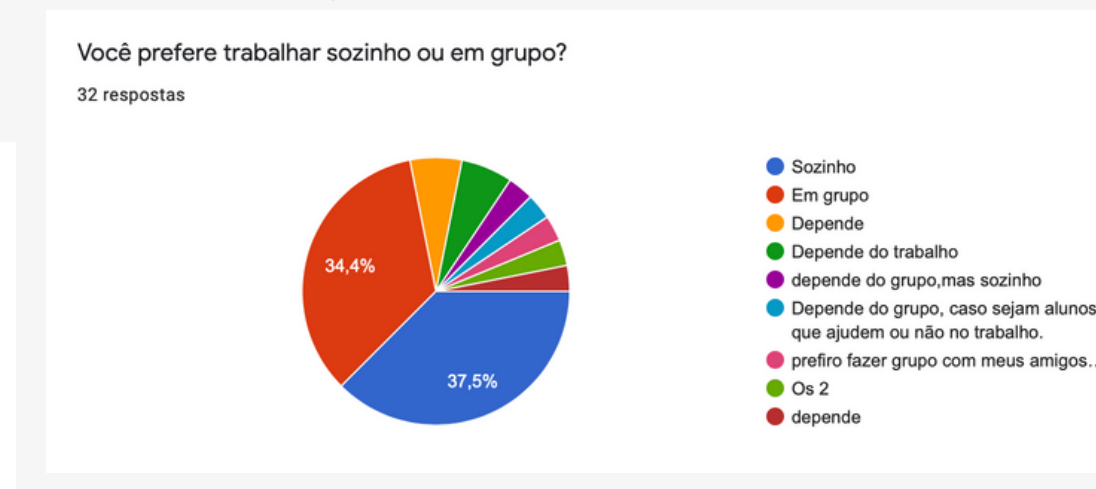
Figura 5: 2