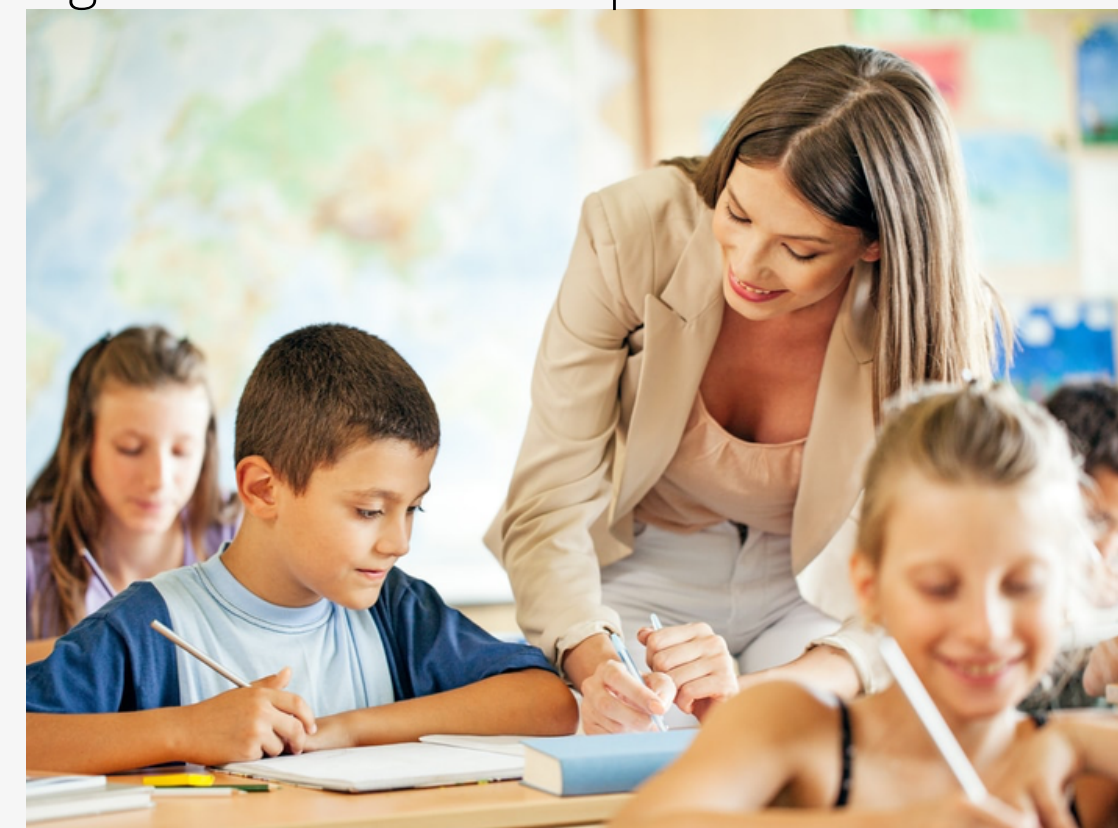
Figura 1: Professora explicando

De acordo com essa realidade, recebemos as ferramentas que utilizaremos no restante de nossas vidas para interpretar o mundo no decorrer de nossa socialização.