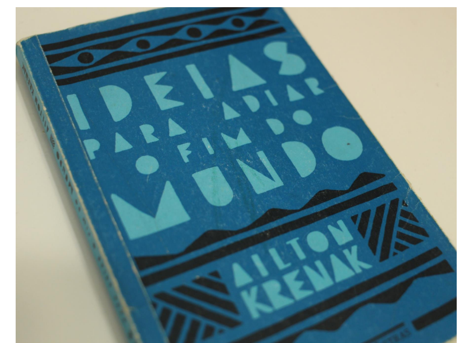
Imagem 2: Capa do livro Ideias para Adiar o Fim do Mundo (2019).

Para mudar esse cenário catastrófico, podemos adotar medidas com: economia de água e energia, separação de lixo, diminuição do uso de automóveis, utilização de produtos biodegradáveis, diminuição do consumo de produtos de origem animal e, principalmente, participação efetiva nas decisões políticas da nossa sociedade.