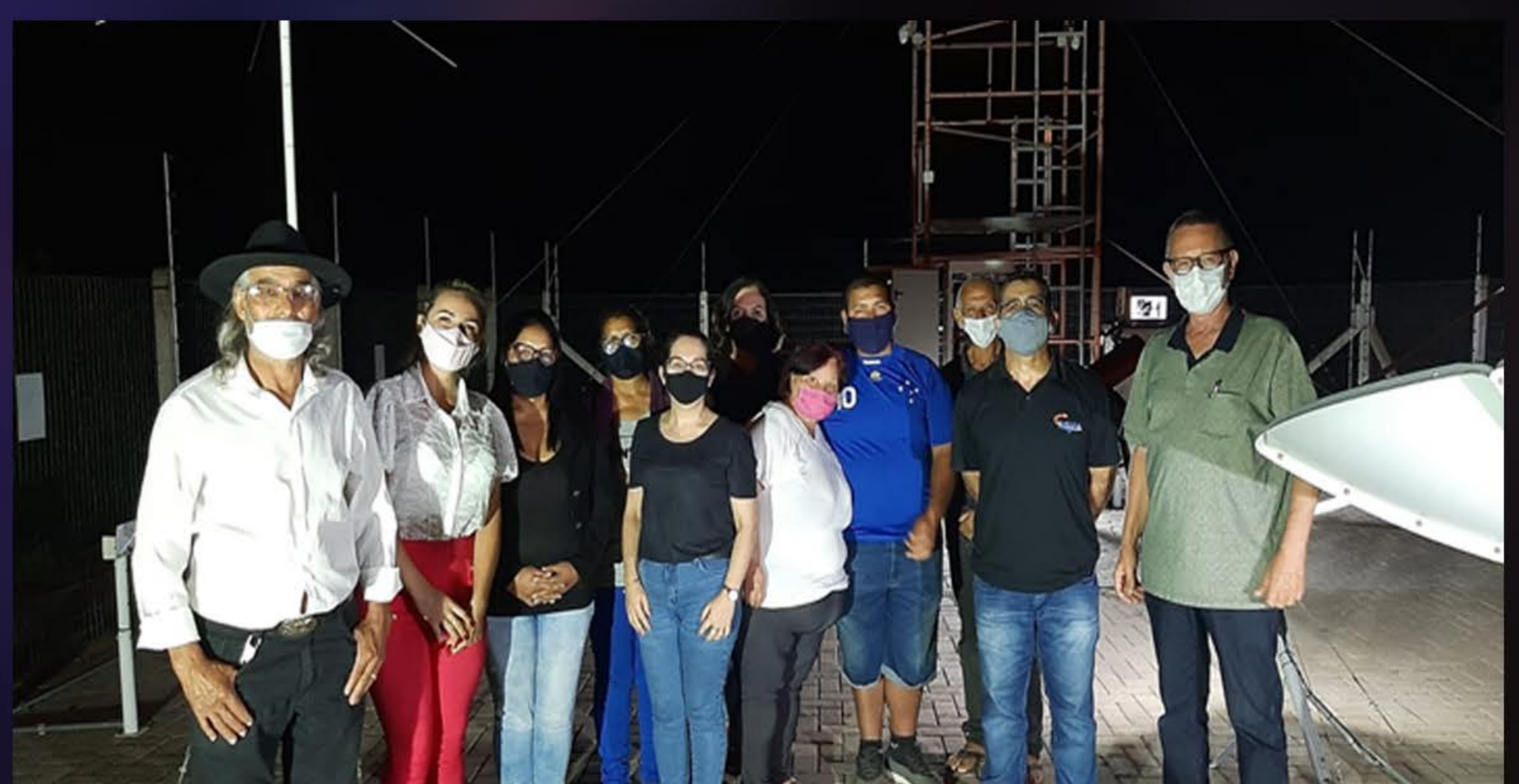
Turma no observatório Heller & Jung.